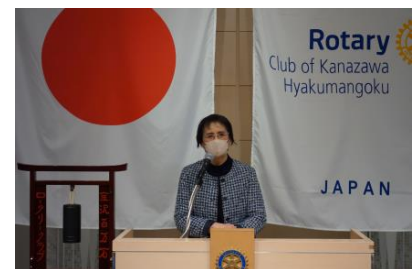
私の楽しみ 宮永会員