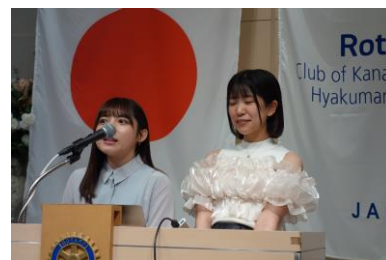
北陸アイドル部の2人